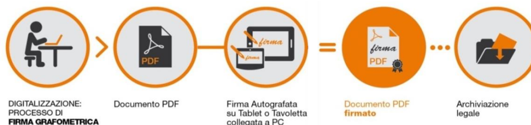
Fig.2 - Schema

I dati cifrati vengono successivamente inseriti nel pdf attraverso la creazione di una firma conforme allo standard europeo denominato PAdES. La soluzione prevede che, a sigillo di ogni firma apposta sul documento dal CLIENTE, sia applicato un certificato rilasciato da NAMIRIAL CA.