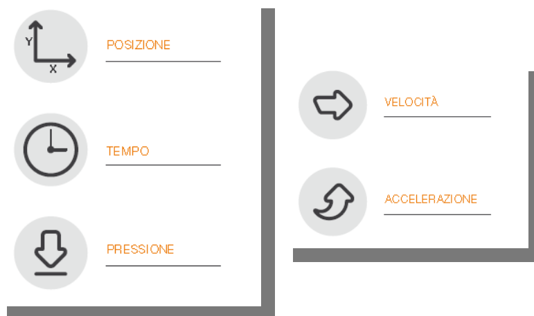
Fig.1 - Schema

Gli elementi disponibili nell'apposizione della sottoscrizione da parte del FIRMATARIO , sono i dati biometrici e comportamentali, quali: Posizione della penna, Pressione, Tratto in aria (percorso che fa la penna quando non tocca nel device, fino a 1cm ), e Tempo. E' possibile elaborare velocità e accelerazione ai fini di analisi forensi.